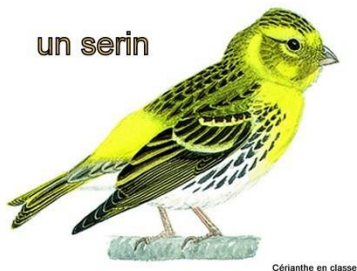
Cérianthe en classe