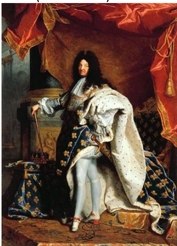
Louis XVI roi guillotiné par les Français